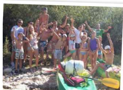
La sortie canoë du Club des Jeunes

Parce que j'étais le 2ème majeur du Club et c'est avec plaisir que j'assume ce poste et mon rôle.